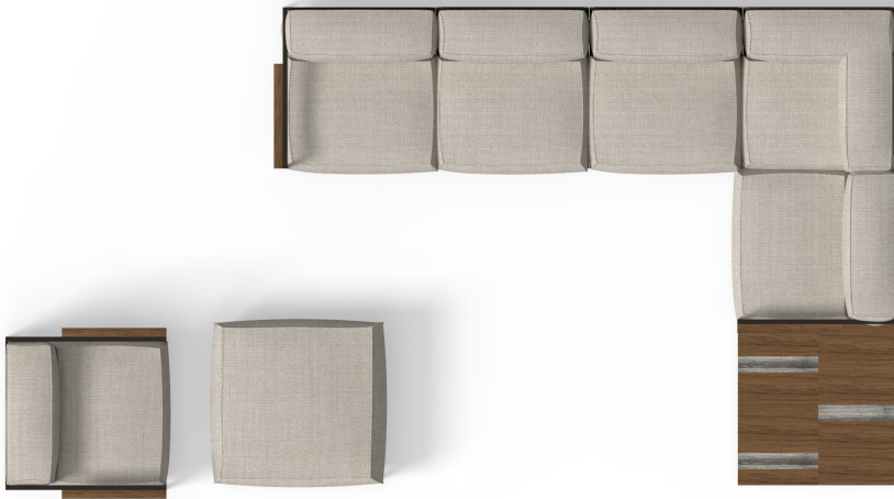
Modular sofas - Dimensions 390x295 cm