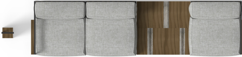
Modular sofas - Dimensions 395x100 cm