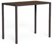
TABLE 125X70 / CODE: CASITP125