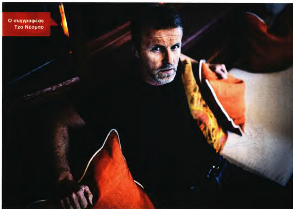
Ο συγγραφέας Τζο Νέσμπο