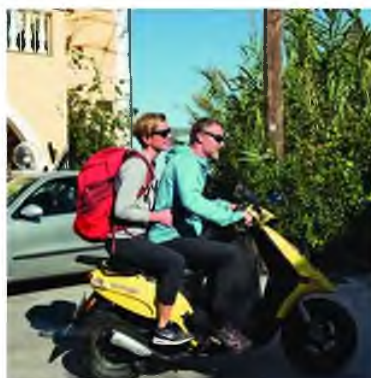
↑ Με τη φίλη του Χάνα φεύγουν από το ξενοδοχείο για το αναρριχητικό πεδίο.

«Ο φόβος είναι το καύσιμο για τις ιστορίες μου. Δεν μπορώ να γράψω αν δεν νιώσω αυτά που περνούν οι χαρακτήρες μου, ακόμα και οι κακοί. Υπάρχει συγγραφέας χωρίς ενσυναίσθηση; Πιστεύω πως όχι».