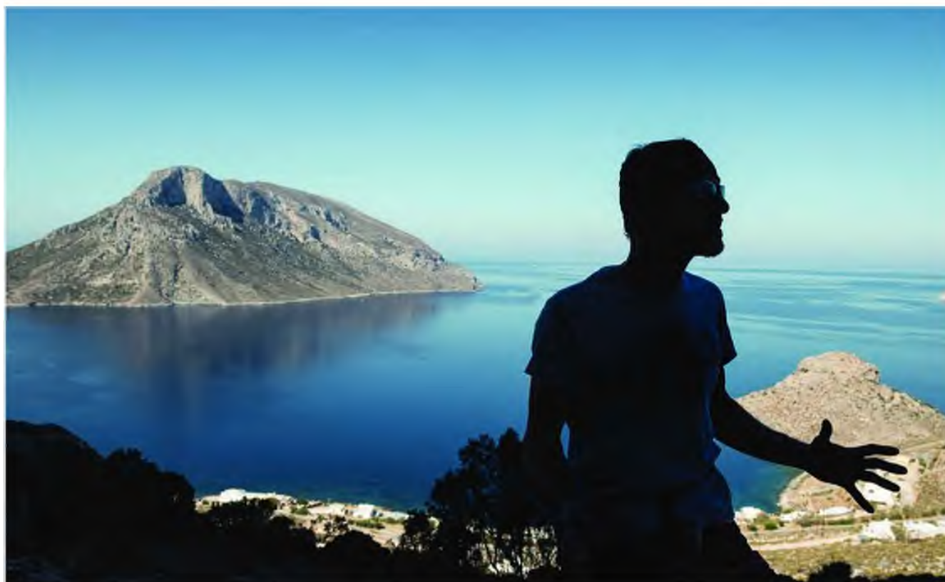
Ο Τζο Νέσμπο στην «Οδύσσεια», με φόντο την Τέλενδο. Με την αναρρίχηση κατάφερε να νικήσει την υψοφοβία του!