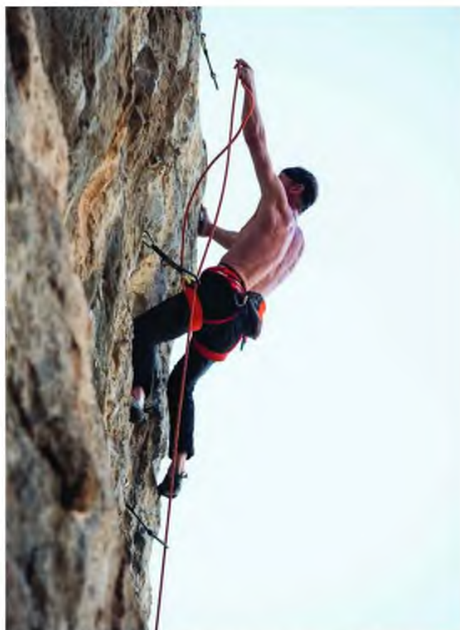
Σκαρφαλώνοντας στη «Σειρήνα», μια διαδρομή ύψους 33 μέτρων, με βαθμό δυσκολίας 7c – αρκετά απαιτητική, δηλαδή.