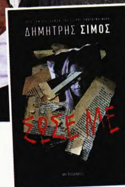
Το εξώφυλλο του βιβλίου «Σώσε με» που κυκλοφορεί από τις Εκδόσεις Μεταίχμιο.

όσο και των υπόλοιπων γυναικών ήταν πρόκληση για τον συγγραφέα. Μαζί με αυτό προστέθηκαν όμως και κάποιες άλλες. «Το να μιλήσεις για μια περιοχή που δεν είναι ο τόπος που ζεις, το να μιλήσεις με ακρίβεια ώστε αν το διαβάσει ένας ντόπιος να καταλάβει τι συμβαίνει και να μην φανεί εσύ χαζός, το να απεικονίσεις ψυχολογικές καταστάσεις με τον ρεαλισμό που απεικονίζονται και στο βιβλίο είχαν τις δυσκολίες τους, αλλά το πιο δύσκολο είναι να φτιάξεις χαρακτήρες αληθινούς και να μιλάνε όπως πραγματικά θα ήταν στη ζωή τους και όχι ψεύτικα» διατυπώνει. Ίσως και για αυτό ο συγγραφέας δεν παραμένει μόνο στο ζετιλίγιο μιας υπόθεσης, αλλά πλαισιώνει την αφήγηση του και με κοινωνικά μηνύματα.