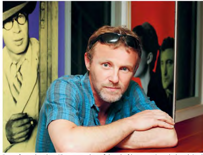
Στις μικρές κοινωνίες, γράφει ο Νέσμπο, τα μυστικά των ανθρώπων είναι διάτρητα και κυκλοφορούν πίσω από κλειστές πόρτες. Μπορεί να κουκουλώνονται για χρόνια, αλλά πάντα επιστρέφουν. Αργά ή γρήγορα, όλα βγαίνουν στο φως.

την κατασκευή ενός σύγχρονου ξενοδοχείου που θα φέρει κρήνη και πλούτο για όλους στη μικρή ορεινή κοινότητα κάνει τους συγχωριανούς του να τον υποδεχθούν με τιμές ήρωα. Το ξενοδοχείο το έχει σχεδιάσει η Σάνον, η εξωτική σύζυγός του από τα νησιά Μπαρμίνεντος, που φαίνεται πως ζεσταίνει και την παγωμένη καρδιά του Ρόι. Η επιστροφή του Καρλ όμως δεν ζητά μόνο χαρούμενες αναμνήσεις. Ερωτες που χάθηκαν, προδοσίες, πάθη και καλά κρυμμένα μυστικά αναδύονται και έρχονται στην επιφάνεια για να πάρουν την εκδίκησή τους. Η ευλογία και η κατάρα των χωριών, γράφει ο Νέσμπο, είναι η διαφάνεια. Στις μικρές κοινωνίες τα μυστικά των ανθρώπων είναι διάτρητα και κυκλοφορούν πίσω από κλειστές πόρτες. Μπορεί να καλύπτονται ή να κουκουλώνονται για χρόνια αλλά πάντα επιστρέφουν. Αργά ή γρήγορα όλα βγαίνουν στο φως. Το ίδιο φαίνεται πως γίνεται και με τα εγκλήματα στο «Βασίλειο». Τα δύο αδελφια κοιβαθούν ένα ένοχο μυστικό που έχει καθορίσει τη ζωή και τις πράξεις τους, ένα έγκλημα που ξεκινάει πολύ πριν το αυτοκίνητο των γονιών