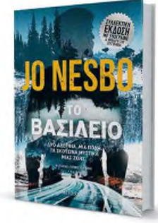
«Το βασίλειο» κυκλοφορεί στα βιβλιοπωλεία στις 17 Σεπτεμβρίου.

κλεισμένων, κοινωνιών της νορβηγικής υπαίθρου. Χαμηλό επίπεδο μόρφωσης μεταξύ των νέων, ναρκωτικά, αλκοόλ, δουλειές του ποδαριού, ίντριγκες, παράνομοι έρως, φαινόμενα ενδοοικογενειακής κακοποίησης, βία, αδιέξοδα. Ωστόσο, δεν λείπουν οι αγαπημένες αναφορές του συγγραφέα στην καλή μουσική, στη λογοτεχνία και στις ταινίες, όπως το «Crash» του Κρόνμπεργκ – όχι τυχαία – εκεί που δεν το περιμένεις. Συναίσθημα αγωνίας Οι θαυμαστές του Νέσμπο δεν θα μείνουν παραπονεμένοι από τον γρήγορο ρυθμό και το σασπένς που κατορθώνει να διατηρήσει ο συγγραφέας στις περίπου 700 σε-