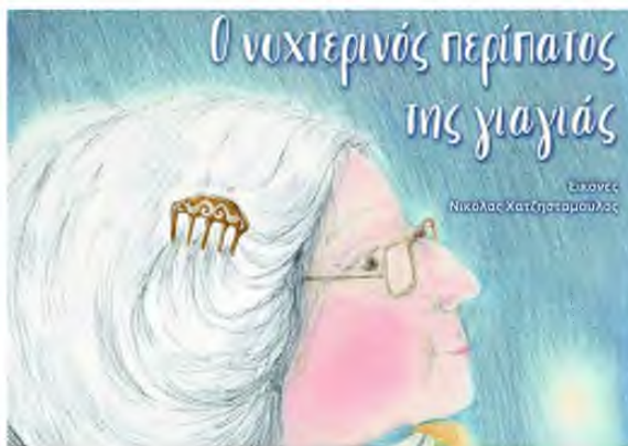
Το εξώφυλλο του τελευταίου βιβλίου της Αλκς Ζέη.

Σαν να μας στέλνει τον δικό της χαιρετισμό, η Αλκς Ζέη είναι κοντά μας. Μέρος των εσόδων από τις πωλήσεις