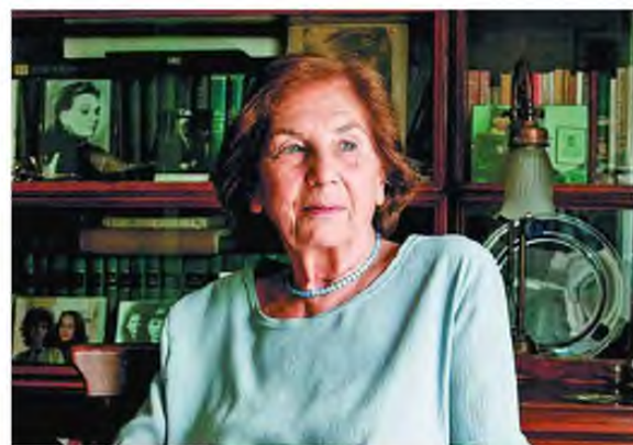
Η Αλκς Ζέη, μία από τις αγαπημένες συγγραφείς μικρών και μεγάλων.

πατος του Πέτρου», κυκλοφορεί σε μορφή γκράφικ νόβελ. Είναι ένα από τα κλασικά και αγαπημένα, για παιδιά από 12 ετών και πάνω, αλλά και για ενήλικους με ανοικτή καρδιά. Αναφέρεται στα χρόνια της Κατοχής, με κύριο συνεκτικό άξονα την ελπίδα. Τη διασκευή του κειμένου έκανε η συγγραφέας Αγγελική Δαρ-