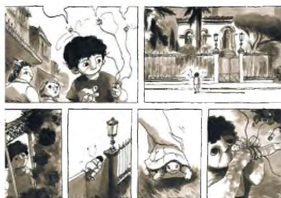
Ο «Μεγάλος περίπατος του Πέτρου» έγινε γκράφικ νόβελ.

Το βιβλίο μπορείτε να το αγοράσετε μέσω Διαδικτύου, έως ότου ανοίξουν τα βιβλιοπωλεία. Και στις 7 Δεκεμβρίου, πάλι από τις εκδόσεις Μεταίχμιο, το αγαπημένο βιβλίο της Αλκς Ζέη, «Ο μεγάλος περι-