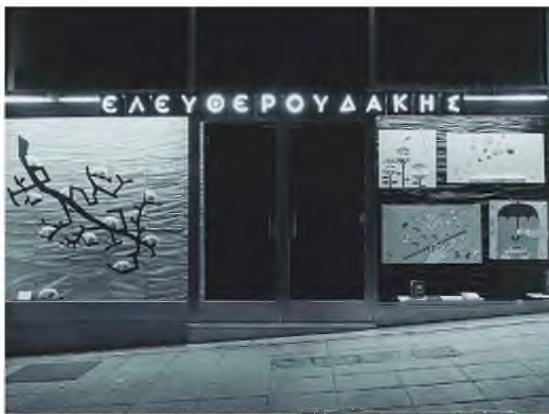
Ο «Ελευθερουδάκης» της δεκαετίας του '60.

γειτονιές, κτίρια, δίκως να χάσεις ποτέ τον ειρμό ή το νόημα, είναι δύσκολη.