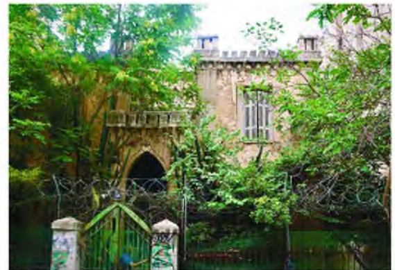
Το νεογοτθικό κτίσμα της οδού Θήρας.

σπάνια βρίσκεις τον χρόνο, την ενέργεια και κυρίως την απαιτούμενη ικανότητα, το υλικό από τα άρθρα για να γίνει κάτι πιο ουσιαστικό, πιο αφομοιωμένο, εντέλει και πιο αυτοβιογραφικό. Να γράφεις αυτό που είσαι και όχι να είσαι αυτό που γράφεις. Από το 1988 μέχρι σήμερα –δηλαδή 32 ολόκληρα χρό-