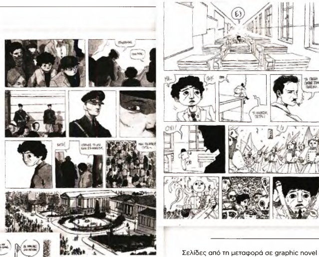
Σελίδες από τη μεταφορά σε graphic novel του «Μεγάλου περιπάτου του Πέτρου»

Το δημοφιλές μυθιστόρημα της Αλκής Ζέη , για το πώς ένα παιδί βίωσε την Κατοχή, κυκλοφορεί πλέον σε κόμικ διασκευή για μικρούς και μεγάλους