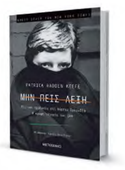
Το βιβλίο «Μην πεις λέξη» κυκλοφορεί από τις εκδόσεις Μεταίχμιο.

θα είναι αιχμάλωτός της», σημειώνει ο συγγραφέας και τονίζει ότι μια κοινωνία πρέπει να αναγνωρίσει τα τραύματά της εάν θέλει να προχωρήσει. «Δεν είναι και η Αμερική σε μια τέτοια διαδικασία αναγνώρισης» ρωτάμε. «Ναι, είναι ένα καλό παράδειγμα. Υπάρχει η τάση να θέλουμε να διαγράφουμε τη σκοτεινή ιστορία της δουλείας και την καταπίεση των Αρροαμερικανών τα μετέπειτα χρόνια και τη βία εναντίον τους. Το μάθημα είναι το ίδιο. Ακόμη και αν το καταπίνετε, το τραύμα δεν φύγει. Πρέπει να αντιμετωπίσετε το παρελθόν. Πήρε εκατοντάδες χρόνια, ωστόσο τώρα γίνεται μια αφήγηση που είχε αρχίσει πολύ».