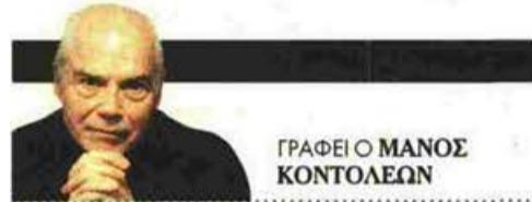
ΓΡΑΦΕΙΟ ΜΑΝΟΣ ΚΟΝΤΟΛΕΩΝ

Η διάσημη συγγραφέας καταγράφει τη σχέση με τη μητέρα της κατά τη διάρκεια των ημερών όπου η δεύτερη βίωσε τη βίαιη πράξη του θανάτου της