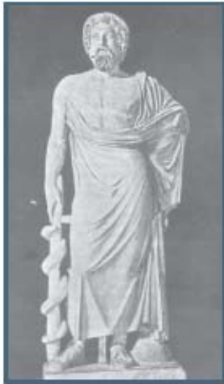
Άγαλμα του Ασκληπιού στο μουσείο Οφίτσι της Φλωρεντίας