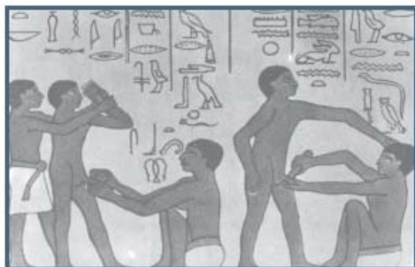
Αναπαράσταση περιτομής από τοιχογραφία τάφου της Σαχίρας