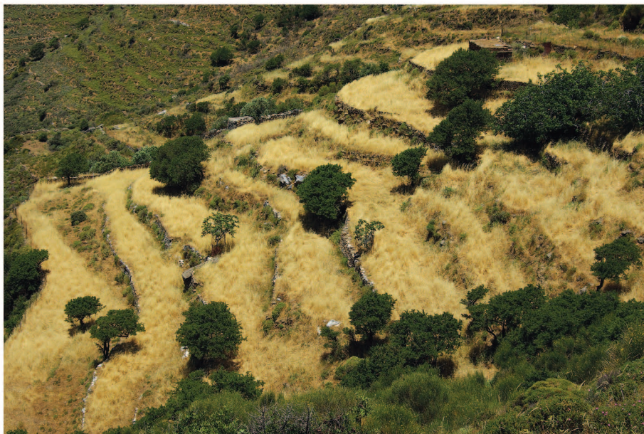
Εικόνα 1.4 Αναβαθμίδες στη Νάξο [2012].

Στο παρόν βιβλίο δίνεται έμφαση στα αποτελέσματα έρευνας των μεγαλύτερων και σημαντικότερων νησιών, που επελέγησαν για λόγους γεωγραφικής ομοιογένειας ως προς το υπόλοιπο υλικό μελέτης (π.χ. εξαιρέθηκαν Ανάφη–Μακρά των Κυκλάδων), επαρκούς υλικού τεκμηρίωσης (εξαιρέθηκαν Αρκοί–Μαράθι), παρουσίας αναβαθμίδων σε αυτά, αλλά και για λόγους διαθεσιμότητας Ψηφιακού Μοντέλου Εδάφους για τη χαρτογράφησή τους. Ειδικότερα, δίνεται έμφαση στα νησιά Πάτμος, Λειψοί, Λέρος, Κάλυμνος–Τέλενδος, Νίσυρος, Σύμη–Νίμος, Μεγίστη–Στρογγύλη, Κάρπαθος–Σαρία, Κάσος–Αρμάθια, που αποτελούν άριστες περιπτώσεις μελέτης αναβαθμίδων, για τους παρακάτω λόγους: