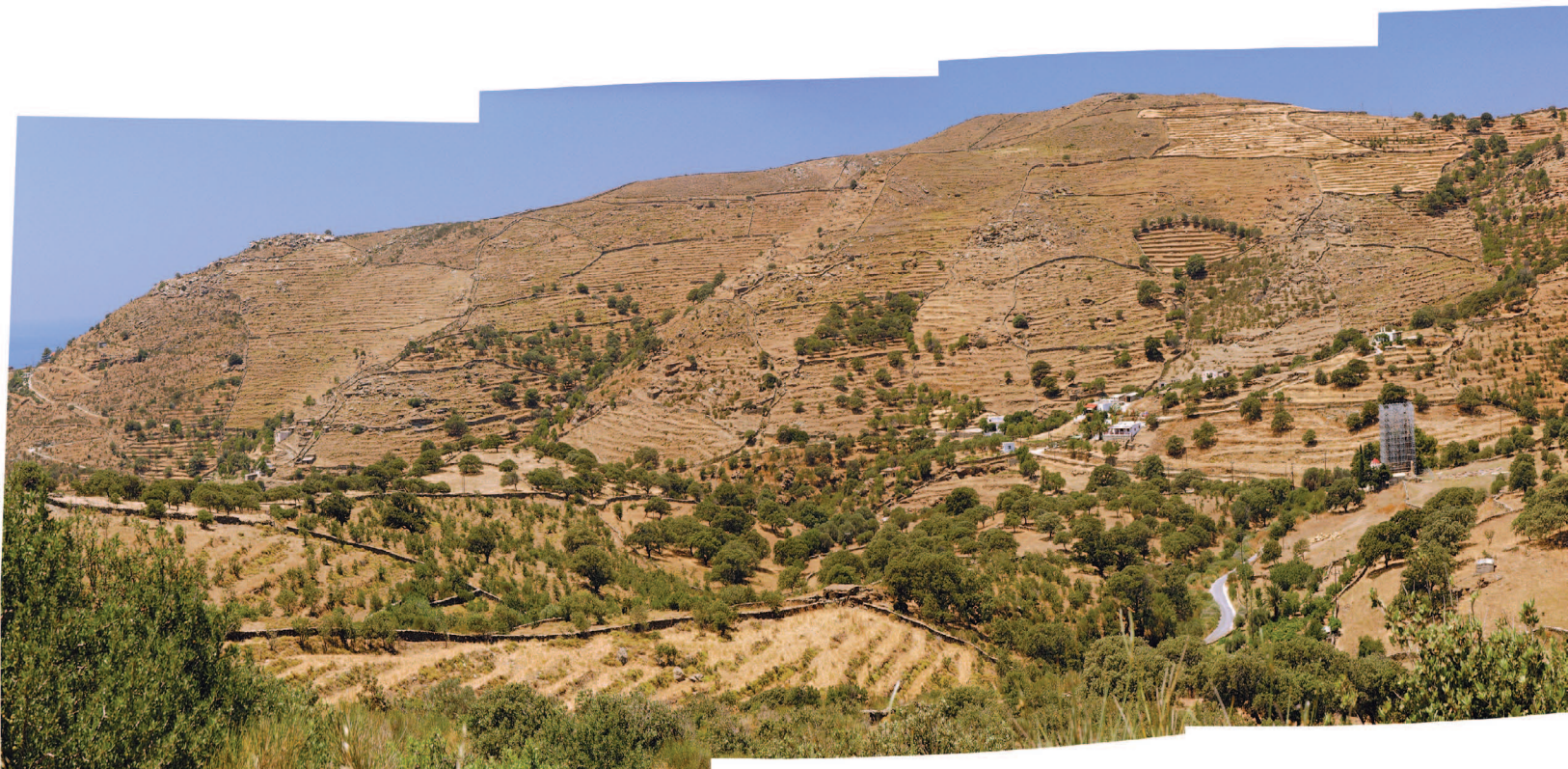
Εικόνα 1.2 Τυπικό τοπίο με αναβαθμίδες στην Κέα των Κυκλάδων, με βλάστηση τύπου dehesa: εκτεταμένη, αλλά αραιή, παρουσία βασιλικής δρυός ( Quercus macrolepis ) σε πυκνό δίκτυο αναβαθμιδών που σπέρνεται με ετήσιες καλλιέργειες [2013].

Η τεκμηρίωση αφορούσε, για κάθε νησί ξεχωριστά, στα παρακάτω συγκεκριμένα στοιχεία: