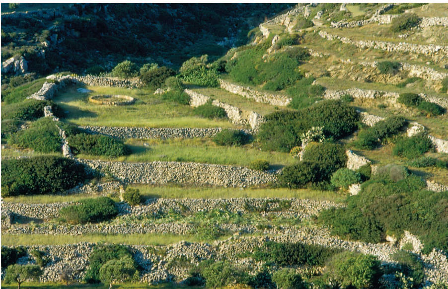
Εικόνα 1.1 Σπαρμένες αναβαθμίδες με το αλώνι στο βάθος, στην Όλυμπο Καρπάθου [2000].