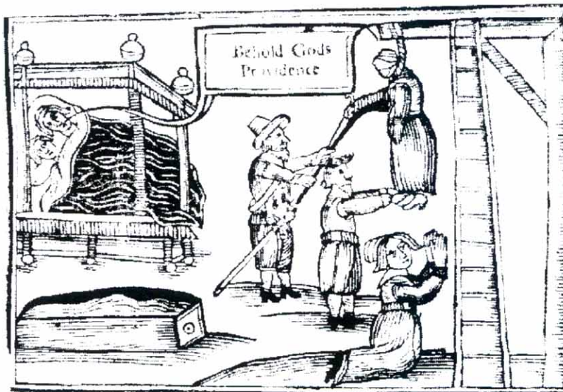
Εικόνα Α.2. Η Anne Green στην αγχόνη «Θελημα Θεού» (Behold Gods Providence).

Κατά τη διάρκεια της νεκροτομής τα μέτρα προστασίας πρέπει να πληρούνται και να τηρούνται αυστηρώς. Η φροντίδα του νεκρού μετά το πέρας της νεκροτομής ανήκει στα καθήκοντα του παρασκευαστή, μέχρι να φύγει ο νεκρός από το νεκροτομείο. Για την τελετή της ταφής αναλαμβάνει ο οίκος τελετών (Εικόνα Α.3).