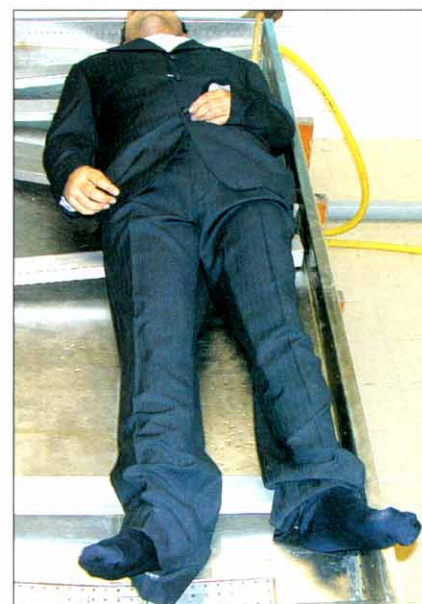
Εικόνα Α.3. Η εικόνα του νεκρού μετά τη νεκροτομή.