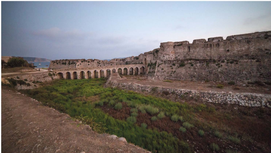
Εικόνα 1.1: Το Κάστρο της Μεθώνης.

Η Μεθώνη είναι μία όμορφη παραθαλάσσια κωμόπολη του νομού Μεσσηνίας, που βρίσκεται στο πιο νοτιοδυτικό άκρο της Πελοποννήσου. Ο πληθυσμός της ανέρχεται περίπου σε 1.300 κατοίκους. Ανήκει διοικητικά στον Δήμο Πύλου-Νέστορος. Κύρια αξιοθέατά της είναι το Μεσαιωνικό Κάστρο, που είναι περιτριγυρισμένο από τη θάλασσα, καθώς και το μαγευτικό ηλιοβασίλεμα. Διατηρεί την παραδοσιακή αρχιτεκτονική και εξαπλώνεται μέχρι τη θάλασσα, με την όμορφη παραλία που συνδυάζει το πράσινο με το γαλάζιο. Στα νότια της Μεθώνης, μέσα στο πέλαγος, διακρίνεται το νησιωτικό σύμπλεγμα των Μεσσηνιακών Οινουσσών, που περιλαμβάνει –μεταξύ άλλων– σημαντικούς βιότοπους, τα νησιά Σχίζα και Σαπιέντζα. Η Μεθώνη απέχει