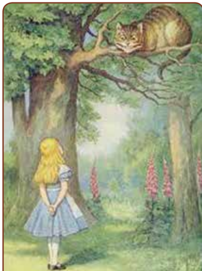
Από την εικονογράφηση της πρώτης έκδοσης της Αλίκης στη Χώρα των Θαυμάτων από τον John Tenniel

Ο μύθος αναφέρεται σε έναν ιππόκαμπο, που «μια φορά κι έναν καιρό μάζεψε τα επτά ασημένια του νομίσματα και ξεκίνησε να βρει την τύχη του». Στον δρόμο του συνάντησε ένα χέλι. «Για πού το έβαλες, φίλε;» τον ρώτησε το χέλι κι εκείνος απάντησε: «Πάω να βρω την τύχη μου». «Είσαι τυχερός» είπε το χέλι. «Με τέσσερα νομίσματα μπορείς να αγοράσεις αυτά τα βατραχοπέδιλα και να φθάσεις εκεί πολύ πιο γρήγορα». Ενθουσιασμένος ο ιππόκαμπος έδωσε τα νομίσματά του και πήρε τα βατραχοπέδιλα, με τα οποία ταξίδευε τώρα με διπλάσια ταχύτητα. Πιο κάτω συνάντησε έναν σπόγγο που με τη σειρά του τον ρώτησε για πού το έβαλε. «Πάω να βρω την τύχη μου» απάντησε ξανά ο ιππόκαμπος. «Είσαι τυχερός» του είπε ο σπόγγος και του πρότεινε με λίγα από τα υπόλοιπα νομίσματά του να αγοράσει ένα θαλάσσιο σκούτερ ώστε να μπορεί να ταξιδεύει πολύ πιο γρήγορα. Έτσι και έκανε ο ιππόκαμπος και ταξιδεύοντας πέντε φορές πιο γρήγορα έπεσε πάνω σε έναν καρχαρία. «Για πού το έβαλες, φίλε;» τον ρώτησε ο καρχαρίας. «Πάω να βρω την τύχη μου» απάντησε εκείνος. «Είσαι τυχερός» του είπε ο καρχαρίας. «Αν κόψεις δρόμο από εδώ», και του έδειξε το ανοιχτό του στόμα, «θα κερδίσεις πολύ χρόνο». «Α, μπράβο, σε ευχαριστώ», είπε ο ιππόκαμπος, ορμώντας μέσα στο στόμα του καρχαρία. «Και από τότε κανείς δεν άκουσε ξανά γι' αυτόν».*